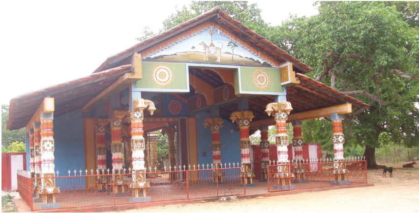
உரும்பிராய் காட்டு வைரவர் கோயில்

ஈழத்துச் சைவர்கள் யாவரும் எவ்வித பாகுபாடுமின்றி தம் விருப்பம் போல் வைரவ விக்கிரங்களை ஆகமம் சார்ந்த முறையிலும் ஆகமம் சாரா முறையிலும் அமைத்து வழிபடுகின்றனர். இதனால் இறைவனுடன் தம்மை ஈடுபடுத்திக் கொள்ளவும், இறைவன் அந்தப் பக்தன் மீது கருணை கொண்டு அவன் பால் அருள் புரியவும் இவ் வைரவத் தலங்களை வழிபடுகின்றனர். ஆதலால் இந்த வைரவத் தலங்கள் சைவ சமயத்தின் வளர்ச்சிக்கு பெரிதும் துணை புரிகின்றன என்று கூறலாம்.