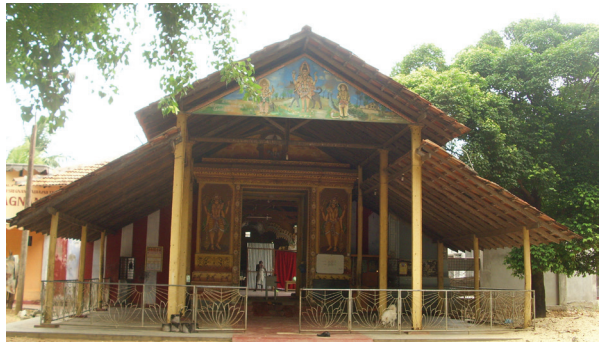
கொக்குவில் தலையாழி ஸ்ரீ ஞானவைரவர் ஆலயம்

யாழ்ப்பாணத்தில் காணப்படுகின்ற வைரவர் ஆலயங்களுள் கொக்குவில் தலையாழி ஸ்ரீ ஞான வைரவர் ஆலயம் குறிப்பிடத்தக்கது. ஈழத்தின் தலை சிறந்த ஆலயமாகக் காணப்படும் இவ்வாலயத்தில் ஆறுமுகநாவலர் புராணபடனம் செய்து வழிபட்டதாகவும், யோகர் சுவாமிகள் தரிசித்து மகிழ்ந்த தலமாகவும் வரலாறுகள் தெரிவிக்கின்றன.யாழ்ப்பாணம் தெல்லிப்பளை ஞான வைரவர் கோயில் பழமை சிறப்பும் புதுமைப் பொலிவும் கொண்ட கோயிலாகும். இந்த ஞான வைரவர் ஆலயம் பசுமையான மரங்கள் சூழக் கம்பீரமான இராஜ கோபுரத்துடன் கலையழகு மிக்க ஆலயமாகவும் இன்று திகழ்கின்றது. யாழ்ப்பாணம், காரைநகர், திண்ணக்களி வைரவர் ஆலமும், தினகரன் பிட்டி வைரவர் ஆலயமும் குறிப்பிடத்தக்க வைரவ ஆலயங்களாகும்.