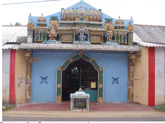
கொக்குவில் கோணாவலை ஸ்ரீ ஞானவைரவர் ஆலயம்

திருகோண மலையில் பாலையூற்று, உவர்மலை, பெருந்தெரு, செங்கலடி ஆகிய இடங்களிலுள்ள ஞான வைரவர் ஆலயங்கள் சிறப்புப் பெற்றவை. கொழும்பு கொட்டாஞ்சேனை ஞானவைரவர் ஆலயம் இப்பிரதேச ஞான வைரவர் ஆலயங்கள் யாழ்ப்பாணப் பிரதேச ஆலயங்கள் போலல்லாமல் அலங்காரத் திருவிழாக்களைக் கொண்டனவாகவே காணப்படுகின்றன இவ்வாறான ஆலயங்களில் நித்திய பூசைகள், விஷேடபூசைகள் என்பன நடைபெறுகின்றன. அர்த்தசாமப்பூசையின்