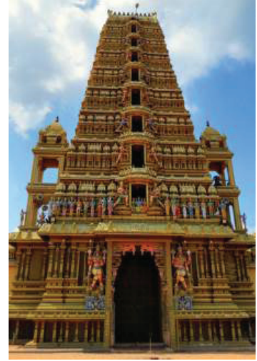
உடப்பு திரௌபதை அம்மன் ஆலயம்

ஏனெனில் திரௌபதி அம்மன் வழிபாடு பல்லவர் காலத்தில் திரௌபதிக்கு ரதக் கோயில் எடுத்து வழிபட்டதிலிருந்தும் விஜய நகர நாயக்கர் காலத்திலும் இவ்வழிபாடும் இதனோடு இணைந்த காளியாட்டமும் காணப்பட்டமையாகும். ஈழத்தில் காணப்படும் திரௌபதி அம்மன் ஆலயங்கள் என்ற வகையில் மட்டக்களப்பு பிரதேசத்திலே தான் கூடுதலாகக் காணப்படுகின்றன. அவ்வாறான ஆலயங்களுள், பாண்டிருப்பு திரௌபதியம்மன் ஆலயம், ஆரையம்பதி திரௌபதியம்மன் ஆலயம், பழுகாமம் திரௌபதியம்மன் ஆலயம், புதூர் திரௌபதியம்மன் ஆலயம், புளியந்தீவு திரௌபதியம்மன் ஆலயம் மட்டக்குழி திரௌபதியம்மன் ஆலயம் என்பன குறிப்பிடத்தக்கன. இவற்றை விட புத்தளம் மாவட்டத்தின் உடப்பு என்ற கிராமத்திலுள்ள திரௌபதியம்மன் ஆலயமும் சிறந்த ஆலயமாகக் கருதப்படுகின்றது. இவ்வாறான திரௌபதியம்மன் ஆலயங்களின் சடங்கை ஆற்றுப்படுத்துவோர் பூசாரி என்றே அழைக்கப்படுவார். ஆனால் பழுகாமம் திரௌபதி அம்மனை ஆற்றுப்படுத்துவோர் நம்பியார் என்றே அழைக்கப்படுவார்.