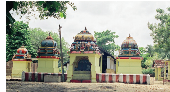
பாண்டிருப்பு திரௌபதை அம்மன் ஆலயம்

ஒவ்வொரு சமயியும் நாள்தோறும் மூன்று நேரங்களிலும் பல சடங்குகளைச் செய்ய இந்து மதம் வழிவகுக்கின்றது. சமயம் தோன்றிய பின் அதனுடன் இணைந்து சில சடங்குகள் காணப்பட்டன. அச்சடங்குகள் மந்திரச் சமயச் சடங்குகள் எனப்பட்டன. நாட்டார் தெய்வ வழிபாடுகளுள் இச்சமயச் சடங்குகள் காணப்படுகின்றன. மேல் நிலையாக்கம் பெற்ற கோயில்களில் நிகழும் சடங்குகள் மந்திரத்தன்மை குறைந்த சமயச் சடங்குகளாகும். இங்கே பூசகர் சடங்குகளை நடத்துபவராகவும், பக்தர்கள் பார்வையாளர்களாகவும் இருப்பர். ஆனால் நாட்டார் தெய்வ வழிபாட்டில் மக்களின் நேரடியான பங்களிப்பினைக் காணலாம். நாட்டார் தெய்வ வழிபாட்டின் போது பண்டம் எடுத்தல், மடைபரவுதல், தூளிபிடித்தல், கதவு திறத்தல், சந்தனக் காப்பிடல், பலியிடுதல், கலையாடுதல், சூனியம் வெட்டுதல்,