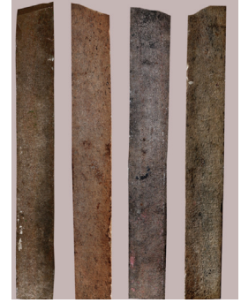
முதலாம் இராஜேந்திர சோழனுது கல்வெட்டு

கிழக்கிழங்கையில் முதன் முதலாக உருவாக்கப்பட்ட சித்திரத்தேர் இதுவாகும். 1981 ஆம் ஆண்டு இந்தத் தேர்களைப் பாதுகாப்பதற்காக பெரும் பணச்செலவில் தேராலயம் ஒன்று அமைக்கப்பட்டு உள்ளது.