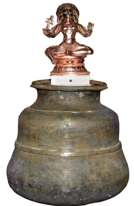
செப்பு கிடாரமும் புராதன அம்மனும்