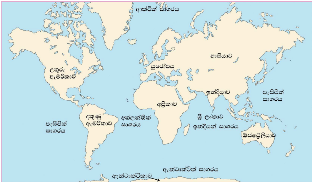
4.3 සිතියම ලෝක සිතියම ඇසුරින් ශ්‍රී ලංකාවේ පිහිටීම