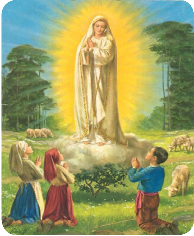
22.2 රූපය - පාතිමා නුවර දේව මාතාවන් දර්ශනය වීම

එක ම පවුලේ සොහොයුරු සොහොයුරියන් වූ ප්‍රැන්සිස් හා ජසින්තාත් ඔවුන්ගේ ශෝකි සොහොයුරිය වූ ලූසීන් පාතිමා නුවර ජීවත් වූහ. තම පවුල්වලට අයත් සතුන් රැකබලා ගැනීම ඔවුන් වෙත පැවරුණු කාර්යයකි. 1917 මැයි 13වන ඉරු දින සුපුරුදු පරිදි මෙම දරුවන් තම පවුල්වලට අයත් බැටළුවන්ට තණ කවමින් සිටියෝ ය. එකවර ම විදුලි කෙටීමක් වැනි ආලෝක ධාරාවකින් ඔවුන් සිටි ප්‍රදේශය ආලෝකවත් විය. බියට පත්වුණු දරුවෝ එතැනින් නික්මෙන්නට සුදනම් වෙන් ම ඒ අසල වූ එතරම් උස් නොවූ ඕක් පඳුරක ආලෝක ධාරාවක් මැද හිඳ තමන් දෙස බලා සිටිනා රූමත් කාන්තාවක් දුටුවෝ ය. ජපමාලය ද අත දරා සිටි එතුමිය “බිය නොවන්න, මම ඔබට අනතුරක් නොකරමි”යි ප්‍රකාශ කළා ය. සිතට දිරිගත් ලූසී “ඔබ ආවේ කොහින් දැයි ඇසූ ප්‍රශ්නයට “මම ආවේ ස්වර්ගයෙන්” යැයි එතුමිය පිළිතුරු දුන්නා ය. ලෝකවාසි පව්කරුවන්ගේ සිත් හැරීම සඳහා මැදිහත් වන ලෙස දරුවන්ගෙන් ඉල්ලූ එතුමිය ඒ වෙනුවෙන්, “ජපමාලය කියන්න, හරියට කියන්න” යයි පවසමින් නොපෙනී ගියා ය.