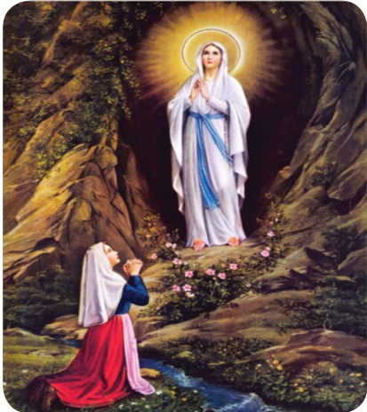
22.3 රූපය - ලූර්දු නුවර දේව මාතාවන් දර්ශනය

(ලිඩ්වින් කිරි ඇල්දෙණියගේ අසිරිමත් දේවමාතා දර්ශනය නමැති කෘතියෙනි)