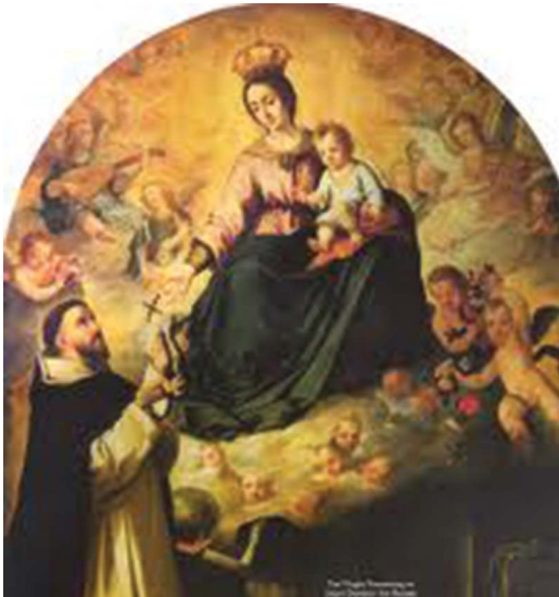
22.1 රූපය - දොමිනික් ගුස්මාන් පියතුමන්ට දේව මාතාවන් දර්ශනය වීම

දොමිනික් ගුස්මාන් පියතුමන්ට දේව මාතාවන් දර්ශනය වීම.