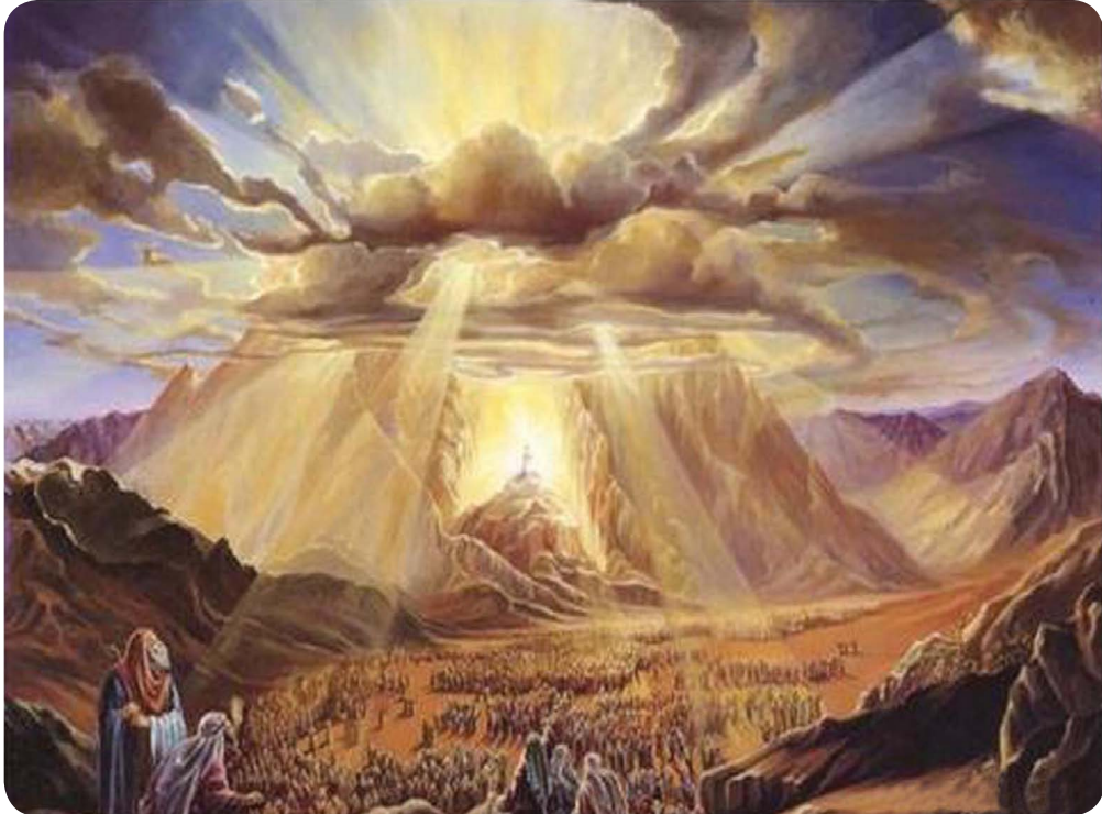
13.1 රූපය - සීනයි කඳු මුදුනේ දී දස පනත ලබාදීම

මෙම චිත්‍රය මගින් පෙන්වනු ලබන්නේ, සීනයි කඳු මුදුනේ දී දෙවියන් වහන්සේ මෝසෙස් තුමාට දස පනත දුන් ආකාරය යි. මෝසෙස් තුමා දස පනත ලබා ගැනීමට පෙර දින 40ක් යාච්ඤා කළේ ය.