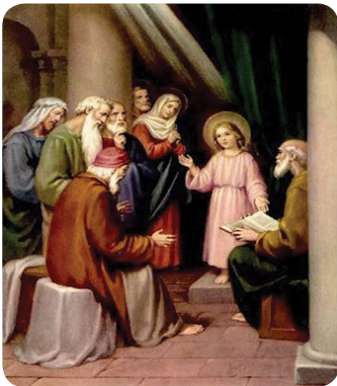
8.1 රූපය - පඬිවරුන් සමග ජේසු කුමරුන් දේව මාලිගාවේ

ඒ බව නොදත් දෙමව්පියෝ, ජේසු කුමරාණන් තම නෑ මිතුරන් අතර සෙවූහ. එතුමා ඔවුන් අතර නොසිටි බැවින් ජෙරුසලමට පෙරළා ගියහ. තෙදිනකට පසු මරිය තුමිය හා ජුසේ තුමා ජෙරුසලමට පැමිණියෝ ය. දේව මාලිගාවෙහි පඬිවරු මැද වැඩ හිඳිමින් ඔවුන් අසන ප්‍රශ්නවලට පිළිතුරු දෙමින් සිටින ජේසු කුමරා දුටුහ.