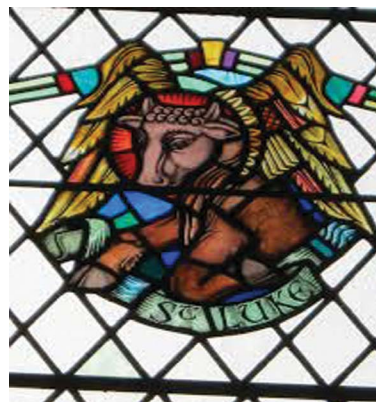
3.6 රූපය - සංකේතය ගවයා

ශු. ලූක් කුමා ක්‍රිස්තුන් වහන්සේගේ අපෝස්තුලුවරයෙක් නොවේ. එතුමා වෛද්‍යවරයෙකි; ඉතිහාසඥයෙකි; වික්‍ර ශිල්පියෙකි. ශුභාරංචියක් ලියන ලද