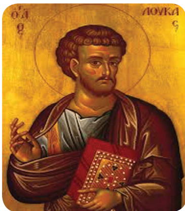
3.5 රූපය - ශු. ලූක් කුමා