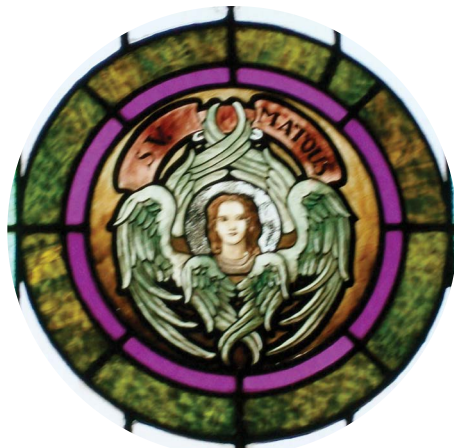
3.2 රූපය - සංකේතය මිනිසා

ශු. මතෙව් තුමා ජේසුස් වහන්සේගේ අපෝස්තුලුවරු දොළොස්දෙනාගෙන් කෙනෙකි. කැදවීමට පෙර එතුමා අය බදු එකතු කළ අයකැමියෙකි. තම කැදවීමෙන් පසු ජේසුස් වහන්සේගේ ප්‍රසිද්ධ ජීවිතයේ කොටස්කරුවකු වී ඔවුන් වහන්සේ ව අත්දැකුවේ ය. දිවැස්වැකි බහුල ව ඇතුළත් කර, බලාපොරොත්තු වූ “මෙසියස් වහන්සේ” ක්‍රිස්තුන් වහන්සේ බව පෙන්වා දී ඇත. ජේසුස් වහන්සේගේ වංශාවලියෙන් ශුභාරංචිය ආරම්භ කර ඇත. මෙම ශුභාරංචියේ සංකේතය, ‘මිනිසා’ ය.