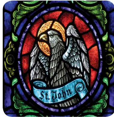
3.8 රූපය - සංකේතය රාජාලියා

ශු. ජොහන් කුමා ජේසුස් වහන්සේගේ අපෝස්තුලුවරයෙකි. එකුමාගේ සහෝදරයා වූ මහා ජාකොබ් කුමා ද ජේසුස් වහන්සේගේ අපෝස්තුලුවරයෙකි. මේ දෙදෙනා ක්‍රිස්තුන් වහන්සේ කැඳවීමට පෙර ධීවරයෝ වූහ. සෙබදි හා සලෝමි ඔවුන්ගේ දෙමාපියෝ ය. මරිය කුමි සලෝමිගේ ඥාතිවරයෙකි. එබැවින් මේ දෙදෙනා ජේසුස් වහන්සේගේ ඥාති සහෝදරයෝ වූහ. තේරුම් ගැනීමට අපහසු සංකල්පනාවකින් මෙය ආරම්භ කර ඇති නිසා, මෙම ශුභාරංචියේ සංකේතය ‘රාජාලියා’ ය.