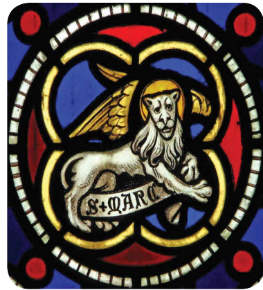
3.4 රූපය - සංකේතය සිංහයා

ශු. මාක් කුමා ජේසුස් වහන්සේගේ අපෝස්තුලුවරයෙක් නොවේ. එතුමා ශු. පේදුරු කුමාගේ ගෝලයෙකි. ජොහන් මාක් යනුවෙන් ද හඳුන්වනු ලැබූ මෙතුමා, පේදුරුකුමාගේ භාෂා පරිවර්තකයා ලෙස ද කටයුතු කර ඇත. එම නිසා ජේසුස් වහන්සේ පිළිබඳ බොහෝ තොරතුරු පේදුරු කුමාගෙන් දැනගන්නට ඇතැයි සිතිය හැකි ය. ස්නාවක ජොහන් කුමාගේ දේශනය පිළිබඳ විස්තරයෙන් ආරම්භ කර ඇත. මෙම ශුභාරංචියේ සංකේතය වන්නේ 'සිංහයා' ය