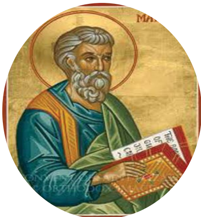
3.1 රූපය - ශු. මතෙව් තුමා