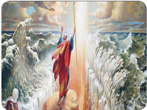
2.1 රූපය - නික්මයාම

ඉද්ධ බයිබලයේ ඇතුළත් දෙවන පොත යි. ඉශ්‍රායෙල් ඉතිහාසයේ කේන්ද්‍රීය සිද්ධිය වන මිසරයේ වහල්කමින් නිදහස ලබා, පොරොන්දු දේශය කරා “නික්මයාම” මුල් කරගෙන ලියවී ඇත. මෝසෙස් කුමා මෙහි ප්‍රධාන චරිතය යි. නික්මයාම ගමන තුළ දෙවියන් වහන්සේගේ ආදරය හා ආරක්ෂාව ඉශ්‍රායෙල් ජනතාව