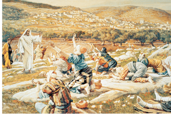
படம் 16.1 இயேசு தொழுநோயாளர்களை குணப்படுத்தல்

தாத்தா : நோயினால் துன்பப்படுபவர்களுக்கும், இவ்வாறு சமுதாயத்தால் ஒதுக்கப்பட்டவர்களுக்கும் கருணைக் காட்டுவது இயேசுவின் பணியின் ஒரு பகுதியாகும். எனவே, அவர் அவர்களை ஏற்றுக்கொண்டு அவர்களுக்கு உதவி செய்தார். இயேசுவிடம் வந்த இந்த பத்து தொழு நோயாளர்களும் தூரத்தில் நின்று, ஐயா இயேசுவே எங்களுக்கு இரங்கும்” என வேண்டினார்கள். அவர் அவர்களைப் பார்த்து “நீங்கள் போய் உங்களைக் குருக்களிடம் காண்பியுங்கள்” என்றார் .