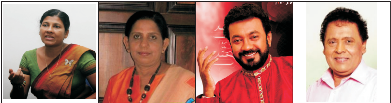
A B C D