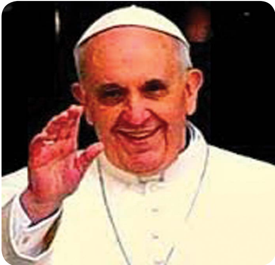
9.2 රූපය - අති උතුම් ග්‍රැන්සිස් ශුද්ධෝක්තම පියතුමා

ශුද්ධ වූ ජේදුරු කුමාගෙන් පසු ව අඛණ්ඩ ව එම තනතුරට ශුද්ධෝක්තම පියවරු තේරී පත් වෙති. ශුද්ධෝක්තම පියතුමා බලයෙන් ද ගෞරවයෙන් ද අන් සියලු රාජගුරු ප්‍රසාදිවරුන්ට වඩා උසස් වෙයි. ශුද්ධෝක්තම පියතුමකු පත් කරනු ලැබූ විට අභිනව නාමයක් ගැනීම සිරිතකි. එතුමාණන් මෙලෝ කිසි ම ලෞකික බලයකට යටත් නොවේ. කතෝලිකයන් ලෙස අපි සැම ශුද්ධ වූ කතෝලික සභාවේ නීති රීති හා සම්ප්‍රදායයන් පිළිපදිමු. ශුද්ධ වූ සභා ශ්‍රේෂ්ඨයන්ට ගරු කරමු කීකරු වෙමු.