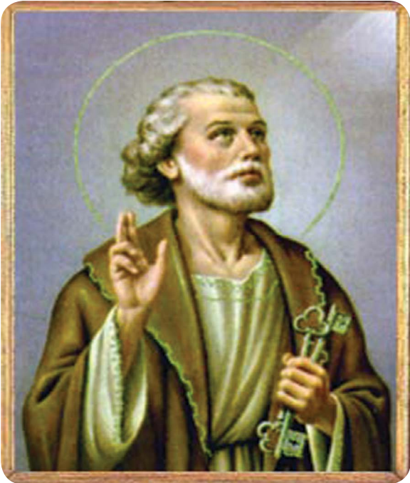
9.1 රූපය - ශුද්ධ වූ ජේදුරු තුමා

දිනක් ජේසුස් වහන්සේ ගෙනෙසරෙත් විල අසල, ජේදුරු තුමාගේ ඔරුවට නැගී සෙනඟට දහම් පණ්ඩුඩය දේශනා කළ සේක. එය නිම වූ පසු මුහුදට ගොස් දෑල හෙළන්නැයි ඔවුන් වහන්සේ ජේදුරු තුමාට වදාළ සේක. පෙර දින රාත්‍රියේ මසුන් ඇල්ලීමට බෙහෙවින් වෙහෙස වූණු ඔහුට එක ම මාළුවකු වත් අල්ලා ගැනීමට නොහැකි වූ බව ජේසුස් වහන්සේට පැවසූ ඔහු, “එහෙත් ඔබ කියන සේක් නම් දෑල් හෙළමි”යි පවසමින් ඔවුන් වහන්සේගේ අණට කිකරු විය. ඔරුවේ සිටි ජේදුරු තුමා හා ඔහුගේ සොහොයුරු ඇන්ඩෘ තුමා පුදුමයට පත් කරමින් මසුන් රාශියක්