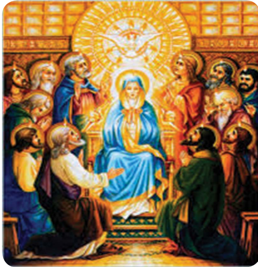
7.1 රූපය - මරිය කුමිය හා ශ්‍රාවක පිරිස වෙත ශුද්ධාත්මයාණන් වහන්සේගේ ආගමනය