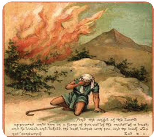
4.2 රූපය - ගිනිගත් නොදූවෙන පසුර

මෙම සංකේතය හඳුනා ගැනීම හා ඒ අනුව ක්‍රියා කිරීම අනතුරුවලින් ආරක්ෂාවීමටත් ඒවා වළක්වා ගැනීමටත් උපකාරී වේ.