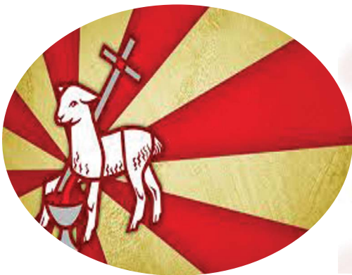
4.4 රූපය - බැටළුවා

බැටළුවා - ක්‍රිස්තුන් වහන්සේ (එළිදරව්ව 5 පරිච්ඡේදය)