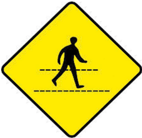
4.1 රූපය - පදිකයින් මාරුවන ස්ථානයක්

අපට හුරුපුරුදු සංකේත කිහිපයක් විමසා බලමු.