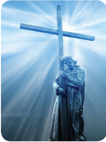
4.3 රූපය - කුරුසිය

දේව ආදරයේ හා ක්‍රිස්තුන් වහන්සේගේ කීකරුකමේ සංකේතය කුරුසිය යි (රෝම 5:8, පිලිප්පි 2:8). කුරුසිය අපගේ ගැලවීමේ සලකුණ යි. කුරුසිය අපට ආහරණයක් නොව පූජනීය වූත් ශුද්ධ වූත් වස්තුවකි. කුරුසියට අමතර ව කිතුනු අපට ම ආවේනික ආගමික සලකුණු ඇති අතර අපි ඒවා ගෞරවයෙන් යුතු ව පරිහරණය කළ යුත්තෙමු.