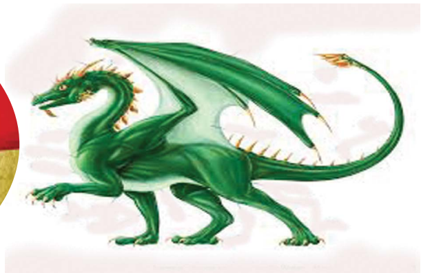
4.5 රූපය - මකරා

බැටළුවා - ක්‍රිස්තුන් වහන්සේ (එළිදරව්ව 5 පරිච්ඡේදය)