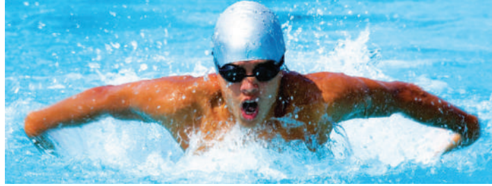
4.11 රූපය - දැනින් ජලය මත බලයක් යෙදීම හා සමාන බලයක් ජලයෙන් ශරීරය මත යෙදීම