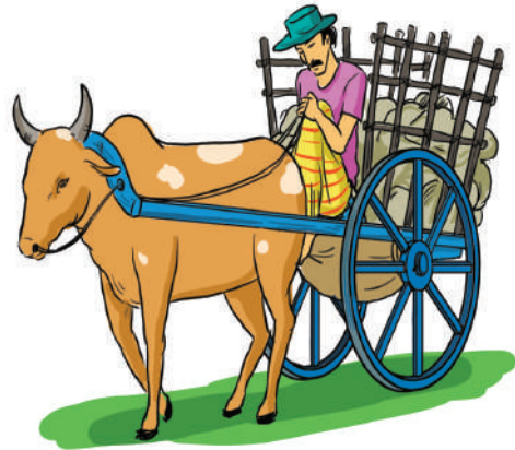
4.3 රූපය - ගොනෙකු විසින් අදින කරත්තයක්

4.3 රූපයේ පෙන්වා ඇත්තේ බර පැටවූ කරත්තයක් ගොනෙකු විසින් ඇදගෙන යන අවස්ථාවකි. කෙනෙක් කරත්තය පසුපස සිට එය වලනය වන දිශාවට බලයක් යෙදුවහොත් සිදුවන්නේ කරත්තය වලනය වන ප්‍රවේගය වැඩි වීම ය. කරත්තය වලනය වන දිශාවට විරුද්ධ අතට බලයක් යෙදුවහොත් එහි ප්‍රවේගය අඩු වන්නේ ය. මෙයින් පෙනෙන්නේ බලයක් යෙදීමෙන් ලැබෙන ඵලය, එම බලයේ දිශාව අනුව වෙනස් වන බවය.