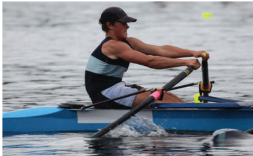
4.10 රූපය - හබලෙන් ජලය වෙත බලය යෙදීම හා ඊට සමාන බලයක් ජලය මගින් ඔරුව වෙත ක්‍රියා කිරීම

ඔරුවක් පදින විට (4.10 රූපය) කෙරෙන්නේ හබලෙන් ජලය පසු පසට තල්ලු කිරීම යි. එනම් බලය යොදන්නේ හබලෙන් ජලය වෙතයි. එවිට ජලය මගින් හබල මත යෙදෙන ප්‍රතික්‍රියාව නිසා ඔරුව ඉදිරියට ගමන් කරයි.