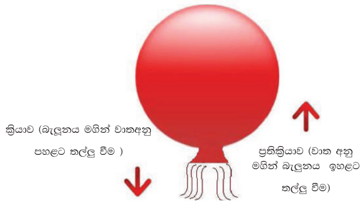
4.7 රූපය - බැලූනයේ වාතය පහළට පිට වී යාම හා බැලූනය ඉහළට ඇදී යාම