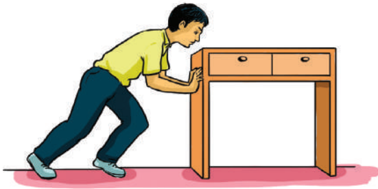
4.1 රූපය - මේසයක් තල්ලු කිරීම

මේසයක් 4.1 රූපයේ පෙන්වා ඇති ආකාරයට තල්ලු කර බලන්න. චලනය ආරම්භ නොවේ නම් යොදන බලය වැඩි කර තල්ලු කරන්න. මෙසේ බලය වැඩි කරන විට එක් අවස්ථාවක දී එය චලනය වීම ආරම්භ වෙයි.