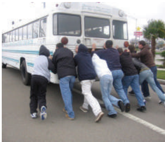
4.2 රූපය - බසයක් තල්ලු කිරීම

මේසය තල්ලු කළ ආකාරයට ම ඔබ තනිවම බසයක් තල්ලු කළහොත් එය චලනය නොවේ. නමුත් 4.2 රූපයේ මෙන් තවත් පිරිසකගේ ආධාරය ඇතිව බසය තල්ලු කළහොත් එය චලනය වනු ඇත. එනම් යොදන බලය වැඩි කළ විට බසය චලනය වීම ඇරඹෙයි. මෙම අවස්ථා දෙකෙහි දී ම සිදුවන්නේ වස්තුව මත යොදන බලය එම වස්තුවේ චලිතයට බාධා පමුණුවන යම් බලයක් අභිබවා ගිය විට එම වස්තුව චලනය වීම ආරම්භ වීමයි. එම වස්තුවේ චලිතයට බාධා පමුණුවන බලය සර්ඡණය නමින් හැඳින්වෙන ප්‍රතිරෝධී බලයකි. අප යොදන බලය කුඩා නම් එම බලය ප්‍රතිරෝධී බලය සමග සමතුලිතතාවට පත්වෙයි. එවිට වස්තුවට යෙදෙන මුළු බලය ශුන්‍ය නිසා එය චලනය නොවෙයි. වස්තුව