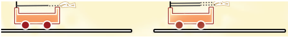
4.6 රූපය - ට්‍රොලිය මත යොදන බලය වැඩිවන විට ත්වරණය වැඩිවන බව ආදර්ශනය කිරීම

නිව්ටන්ගේ දෙවන නියමය සත්‍යාපනය කර ගැනීමට පහත පරීක්ෂණය සලකා බලමු.