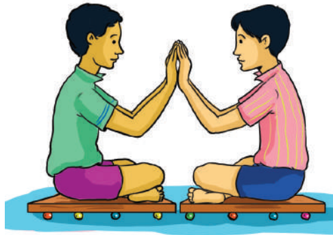
4.9 රූපය - අත්ල මත අත්ල තබා තල්ලු කර ගන්නා ළමුන් දෙදෙනා දෙපසට තල්ලු වී යාම

නිව්ටන්ගේ තුන්වන නියමය යෙදෙන තවත් ප්‍රායෝගික අවස්ථා කිහිපයක් පහතින් දක්වා ඇත.