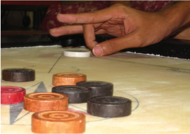
4.4 රූපය කැරම් ඩිස්කයට පහරක් එල්ල කිරීම

කැරම් ලෑල්ලක් මත තිබෙන කැරම් ඩිස්කයට (disk) 4.4 රූපයේ පෙන්වා ඇති ආකාරයට නිය තුඩින් පහරක් එල්ල කරන අවස්ථාවක් සලකන්න. එවිට එම ඩිස්කය ලෑල්ල මත ටික දුරක් ගමන් කර නිශ්චල වේ. කැරම් ලෑල්ලට පුයර දමා හොඳින් මැදීමෙන් පසුව කැරම් ඩිස්කයට නැවතත් නිය තුඩින් පලමු තරමේ ම පහරක් එල්ල කළහොත් එය පෙරට වඩා බෙහෙවින් වැඩි දුරක් ගමන් කර නිශ්චලතාවට පත් වෙයි.