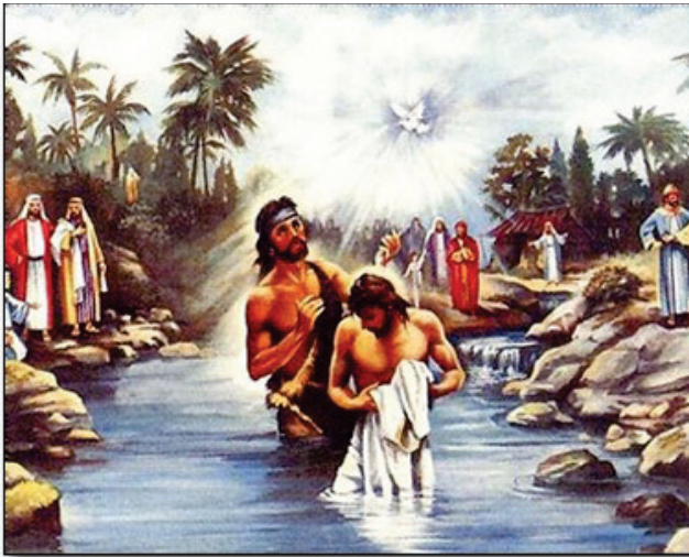
10:2 රූපය - ජේසුස් වහන්සේගේ බෞතීස්මය

”ජොහාන් විසින් බෞතීස්ම ස්නාපනය කචනු ඉටු කේක. උන්වහන්සේ දියෙන් ගොඩ නැගෙත් ව, ස්වර්ගය වච්ච වී ආත්මයාණන් වහන්සේ පච්චියකු වෙන් තවන් පිට බැස වනු දුටු කේක. තව ද ස්වර්ගයෙන් නිකවුණු හඬක්, “ඛබ වාගේ ප්‍රියාදුච පුත්‍රයාණෝ ය. ඛබ කෙරෙහි ඉතා ප්‍රසන්නව සිටිව්” පවසී ය. ශු. වාර්ක් 1 : 10-11