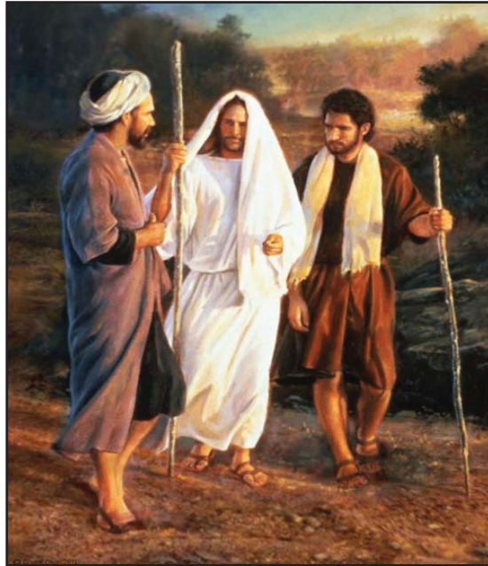
8:2 රූපය - එම්මාවුස් ගමන

එම්මාවුස් ගමන පිළිබඳ ව පහත සඳහන් බයිබල් පාඨ කියවා බලා, එහි සඳහන් සිදු වීම දෙබසක් ලෙස තම අභ්‍යාස පොතේ සටහන් කරන්න.