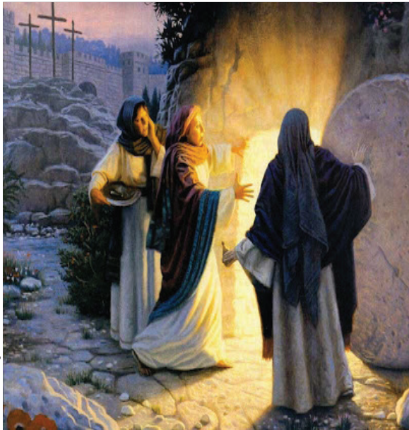
8:1 රූපය - ජේසුස් වහන්සේ කාන්තාවන්ට දර්ශනය වීම

මග්දලායේ මරියා, ජෝවන්නා ජාකොබ්ගේ මව වූ මරියා යන ස්ත්‍රීන් ඇසූ සුඛ ආරංචිය ජේසුස් වහන්සේගේ ශ්‍රාවක පිරිසට පැවසූ කල ඔවුන්ට අදහා ගත නොහැකි විය. ජේසුස් වහන්සේගේ ප්‍රධානතම ශ්‍රාවකයා වූ ජේදරුතුමා සොහොන් ගෙය ලඟට දිවගොස් නැමී බලා හණ රෙදි පමණක් තිබෙනු දැක සිදු වූ කාරණා ගැන පුදුමයට පත් විය. හිස් වූ සොහොන් ගෙය දැකීමෙන් ජේදරු තුමාගේ විශ්වාසය ගොඩනැගුණි.