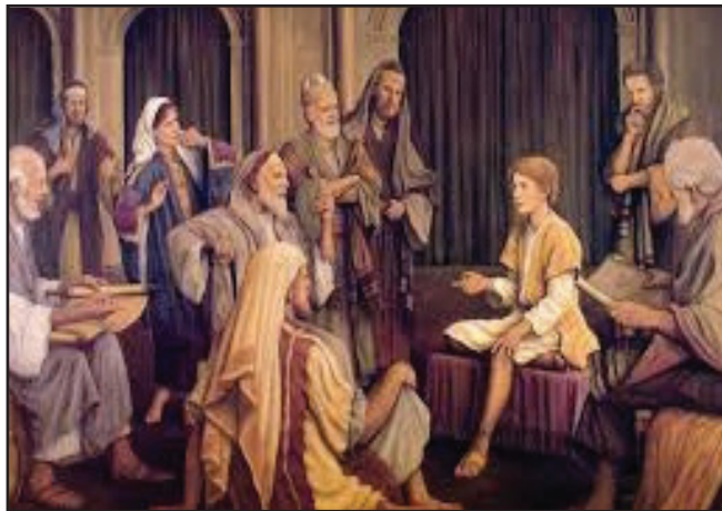
5.1 රූපය - ජේසුස් වහන්සේ දේව මාලිගයේ පඬිවරු සමග

ජේසුස් වහන්සේ වයස අවුරුදු දොළහේ දී මරිය තුමිය හා ජෝසෙප් තුමා සමග ජෙරුසලමේ දේව මාලිගාවට ගිය සේක.