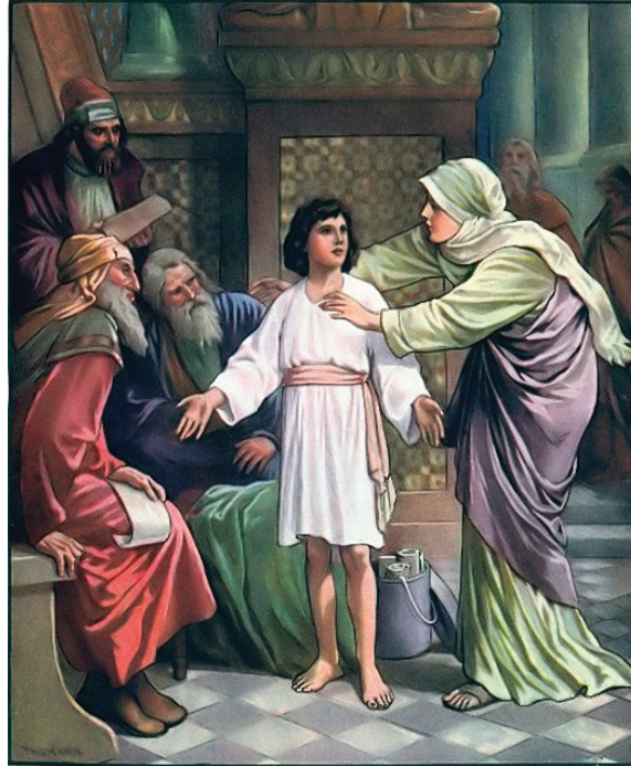
5.2 රූපය - ජේසුස් වහන්සේ මරියකුමිය සමග

කරමින් සිටිනවා ඔවුහු දුටුහ. එම පඬිවරයන් ජේසු කුමරුගේ බුද්ධි මහිමය ගැන පුදුම වූහ. එසේම ජේසුස් වහන්සේගේ දෙමාපියන් ද ඒ ගැන ඉතා මවිතයට පත් වූහ.