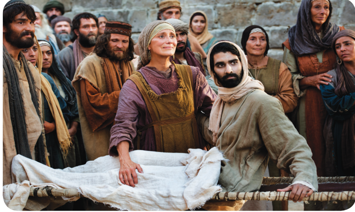
உரு 15.1 மரணத்திலிருந்து உயிரோடு எழுப்பப்பட்ட மகனை தாயிடம் ஒப்படைத்தல்

எழுந்து உட்கார்ந்து பேசத் தொடங்கிய மகனை இயேசு தாயிடம் ஒப்படைத்தார். இயேசு செய்த புதுமையானது வேதனை நிறைந்த கைம்பெண்ணுக்கு பெரும் ஆறுதலாக அமைந்திருக்கும்.