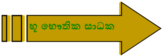
ඉන්දියාවේ භූ විෂමතා