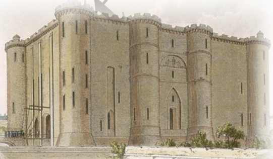
← බැස්ටිල් හිර කඳවුර.