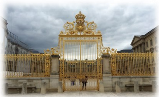
← වර්සේල්ස් මාලිගයේ ඉදිරිපස ගේට්ටුව.

එමෙන් ම මෙම රජවරු ගත කළ අධිසුබෝපබෝගී ජීවිත ජනතා අප්‍රසාදයට බඳුන් විය. රජු වාසය කළ වර්සේල්ස් මාලිගය අක්කර ගණනක් පුරා විහිදුන විශාල එකකි. එය ජලාශ, උද්‍යාන, ජල තටාංග, මල් ගොමු හා අලංකාරයට යෙදූ විවිධ නිර්මාණවලින් සමන්විත විය. රජුගේ මාලිගය රජු ගත කළ අධික සුබෝපබෝගී ජීවිතයේ කැඩපතක් බඳු විය.