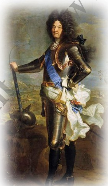
← xiv වන ලුවී රජු

මේ හැරුණු විට ප්‍රංශ ගොවි ජනතාව වැඩි වශයෙන් පීඩාවට පත් වූයේ බදු එකතු කිරීමේ අයිතිය වෙන්දේසියෙන් මිලට ගත් බදු කරුවන්ගේ හිංසා පීඩාවලට ගොදුරු වීම හා ගෙවිය යුතු බදු පිළිබඳව පැවති අවිනිශ්චිතතාව නිසා ය. වරප්‍රසාද ලැබූ පන්තිය බොහෝ බදු වර්ග ගෙවීමෙන් නිදහස් වූ අතර එම බර නිරායාසයෙන් ම ගොවි ජනතාව මත පැටවී තිබුණි.