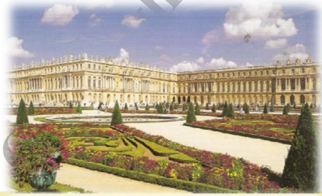
← සම්පූර්ණ වර්සේල්ස් මාලිගය.